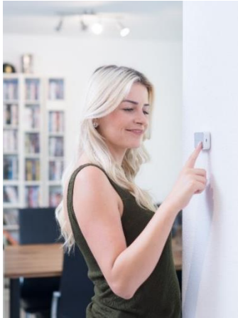
Heute gedrückt – morgen geliefert: der hauseigene BOB.

Sportlich war das Jahr nicht nur für die Schweizer Athletinnen und Athleten an den Olympischen Spielen, sondern auch für BRACK.CH: Das umfangreiche Sortiment konnte von 80'000 auf über 100'000 Artikel ausgebaut werden, das operative Geschäft von baby Müller.ch übernommen und eine Basispartnerschaft mit Intersport Schweiz abgeschlossen.