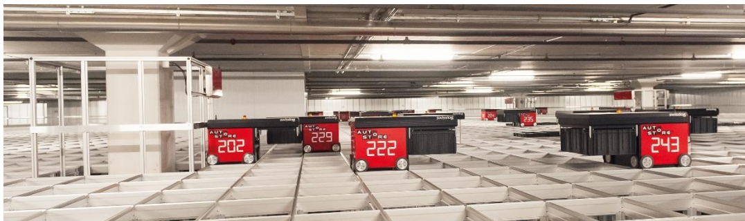
Viel Lagerkapazität auf kleinstmöglichem Raum: die zweite AutoStore-Anlage in Willisau.